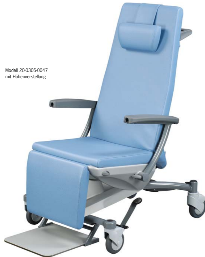
Modell 20-0305-0047 mit Höhenverstellung