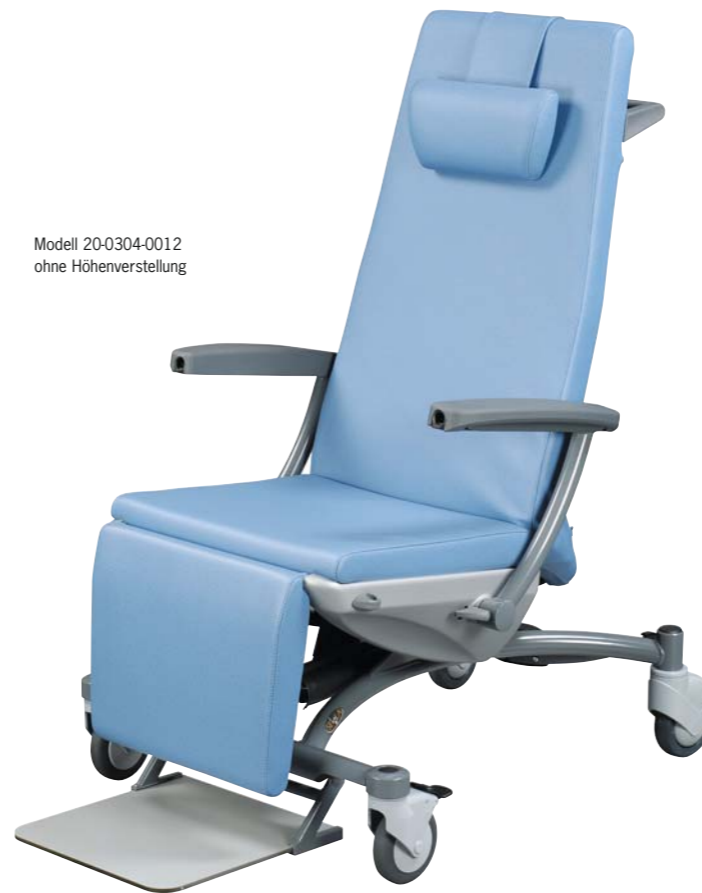
Modell 20-0304-0012 ohne Höhenverstellung